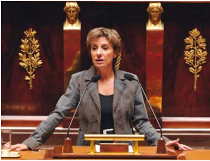
A la tribune de l'Assemblée nationale :